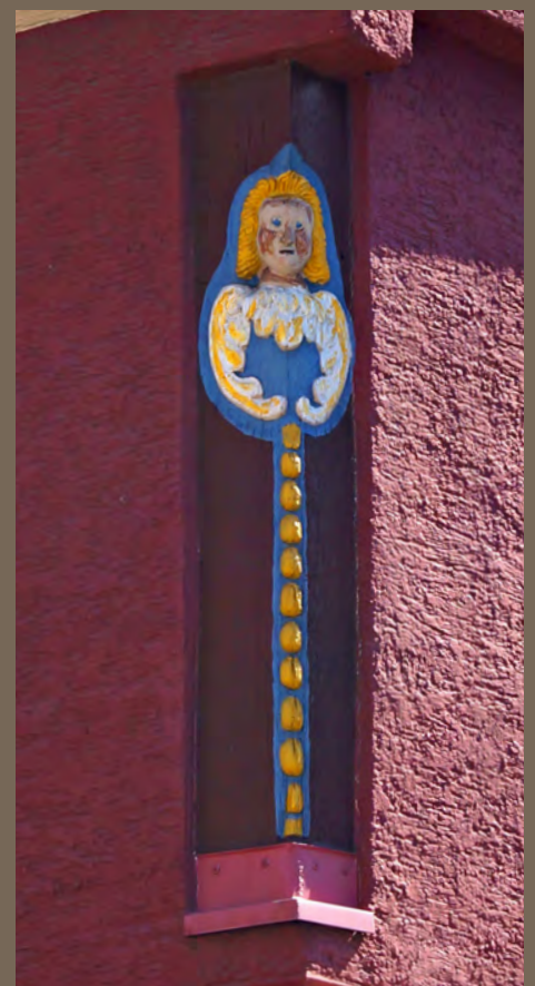
PFORZHEIMER STRASSE / ECKE FRIEDRICHSTRASSE Das schlichteste unter den fünf.