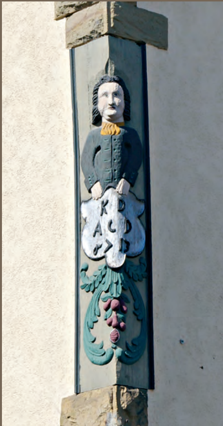
PFORZHEIMER STRASSE 16

Nehmen wir uns die Zeit und schauen sie uns gemeinsam an. Wer mag, rätselt einfach mit an welcher Hausecke er das Eck-Männle vermutet, bevor es genau nachliest ob er richtig liegt. Eigentlich hätte diese Seite das Zeug zu einem Bilderrätsel. Aber viele richtige Einsendungen würden wir wahrscheinlich nicht erhalten. Oder?