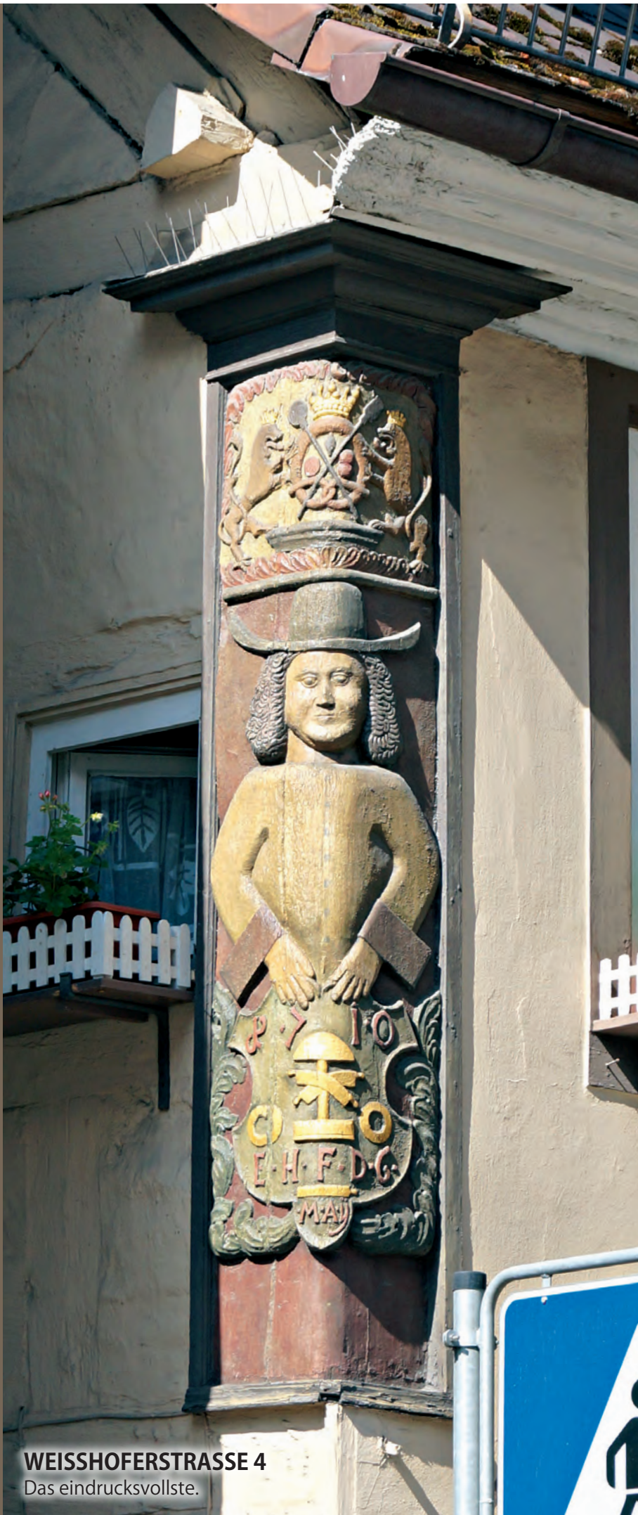
WEISSHOFERSTRASSE 4 Das eindrucksvollste.

Wenn man nicht gerade "Hans Guck in die Luft" ist, fallen sie einem nicht auf. Die Brettener Eckmännle. Gerade die jüngere Generation wird sie kaum noch wahr nehmen. Schaut sie doch – den Blick meist starr nach unten gerichtet – auf das Handy. Schade eigentlich. Denn da entgeht einem so Einiges. Wie die hölzernen Gesellen, die manches Hausecke in Bretten zieren.